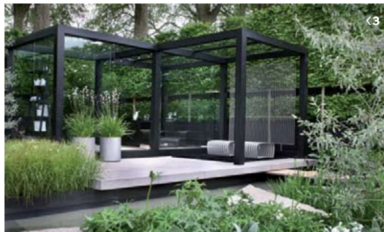
3. Daily Telegraph Garden - הזוכה במקום הראשון. אדריכל הנוף השבדי אולף נורדפייל (Ulf Nordfjell) עיצב גינה בסגנון מודרני ושילב בה צמחים ים תיכוניים כמו אירוס, לוונדר, חצב והרבה גווניים של לבן וסגול.